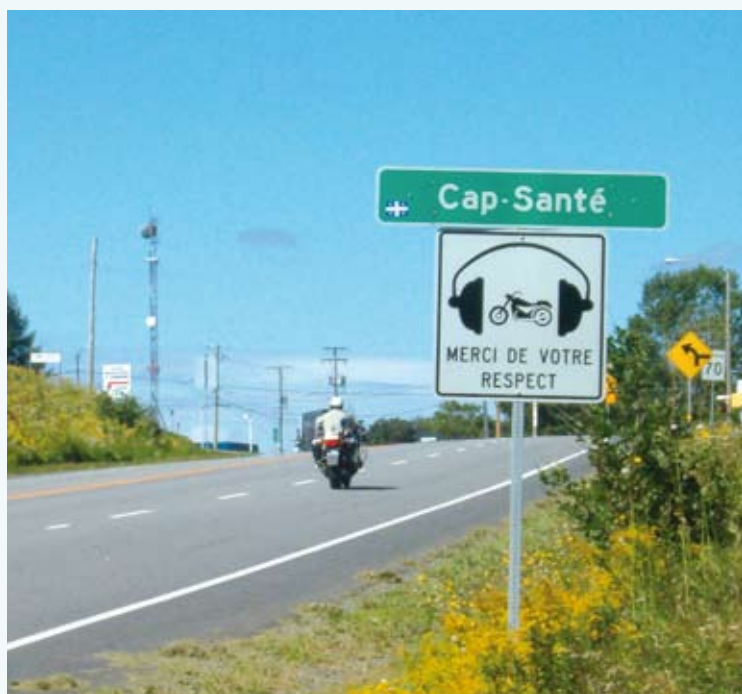
«L'art de vivre sainement» est la devise de Cap-Santé.